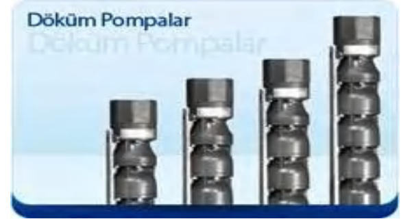
DÖKÜM & BRONZ FANLI POMPA