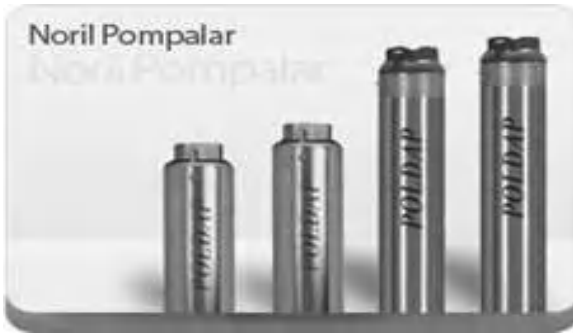
NORIL & PASLANMAZ ÇELİK POMPA